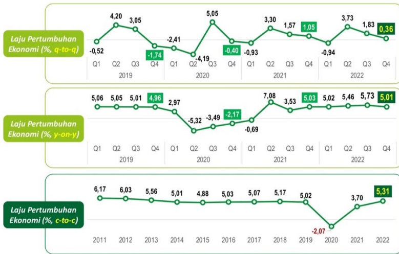
Gambar 4.1: Pertumbuhan Ekonomi Indonesia.