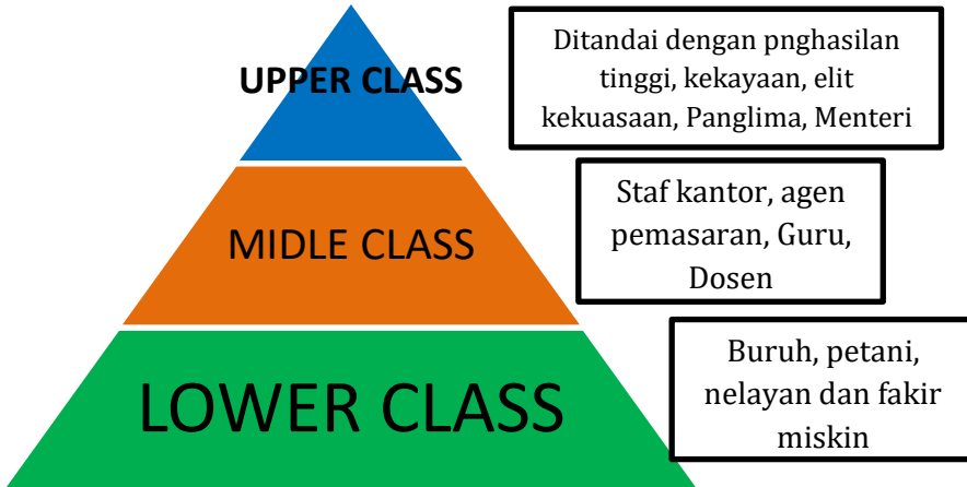
Gambar 9.2: Stratifikasi Sosial

Sistem demikian semata-mata memiliki ciri khusus terpatok dan berperan sasaran penyelidikan. Sistem pertanggung yang diciptakan oleh para warga masyarakat (prestise dan penghargaan). Secara garis besar bentuk Stratifikasi Sosial sebagai berikut: