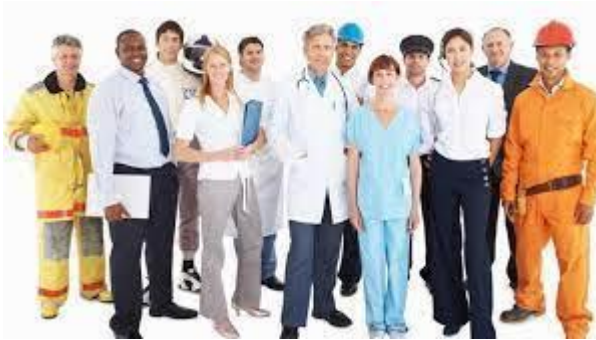
Gambar 11.3: Diferensiasi Atas Dasar Profesi

Mengingat perbedaan dalam panggilan, kita mengenal pertemuan dengan panggilan seperti pendidik, ahli, pedagang, pekerja, pegawai pemerintah, pejuang, dll. Perbedaan profesi biasanya juga akan mempengaruhi cara berperilaku sosial. Misalnya: tingkah laku seorang pendidik tidak akan sama dengan tingkah laku seorang ahli bila keduanya berhasil. Berikutnya adalah gambar Diferensiasi atas dasar profesi: