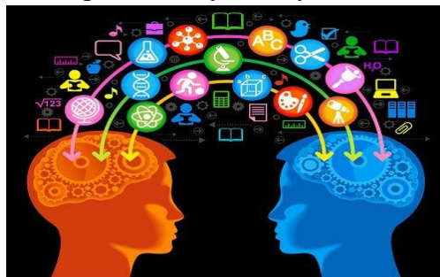
Gambar 1.1: Ilustrasi Psikologi Pembelajaran

Kehadiran psikologi diharapkan mengkaji praktik pengajaran dan pembelajaran dalam area kerja pendidikan. Pembelajaran berfokus pada peserta didik agar berinteraksi dan belajar secara proporsional. Pembelajaran memerlukan dukungan karakter kecerdasan, motivasi belajar, pengendalian diri peserta, serta sarana dan prasarana belajar (Jaenudin and Sahroni, 2021). Problem psikologis dan perilaku dalam interaksi pembelajaran akan berupaya untuk saling memahami praktik belajar peserta didik yang memiliki kebutuhan terhadap ilmu pengetahuan, teknologi dan seni (IPTEKS) terutama era society 5.0 .