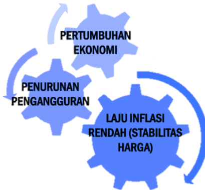
Gambar 6.1: Dimensi Stabilitas Ekonomi Makro