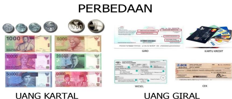
Gambar 3.2: Perbedaan uang kartal dan uang giral