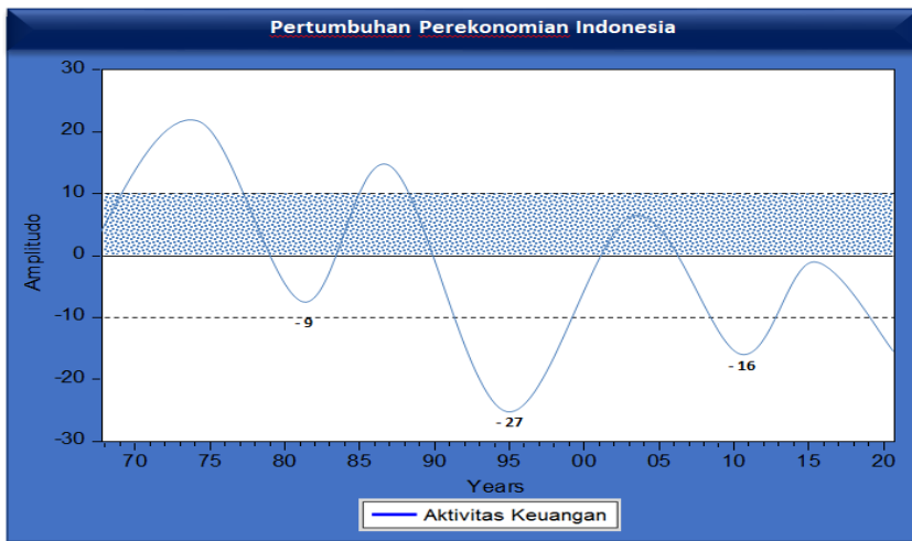
Gambar 7.2 : Pertumbuhan Perekonomian di Indonesia

Aktivitas keuangan lainnya yang dapat mengidentifikasi meningkatnya fluktuasi pertumbuhan jumlah uang beredar ditunjukkan melalui kredibilitas mata uang, hal ini diukur melalui tingkat kepercayaan masyarakat terhadap nilai mata uang dan stabilitas ekonomi suatu negara, ukuran ini ditandai dengan semakin tingginya tingkat kepercayaan mata uang tersebut, maka jumlah yang beredar akan semakin meningkat dan masyarakat akan lebih memilih untuk menyimpan ataupun menggunakan uang tersebut, sehingga akan terjadi fluktuasi keuangan dalam tekanan perekonomian, hal ini tampak pada Gambar 7.2.