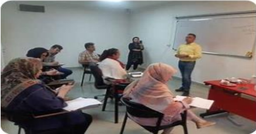
Gambar 14. 9: Contoh Pelatihan dan Ketrampilan Bahasa