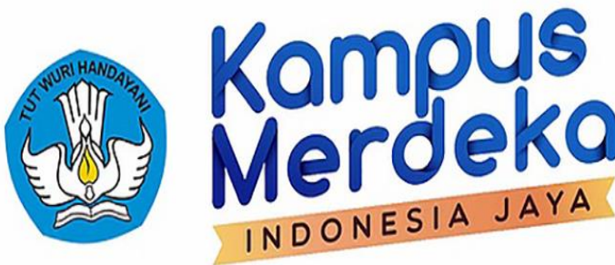
Gambar 6.5: Merdeka Belajar Kampus Merdeka (MBKM)

Keberadaan Merdeka Belajar Kampus Merdeka (MBKM) memberikan ide dan gagasan dan membuka kesempatan besar kepada pendidik dan peserta didik dalam menentukan sistem pembelajaran yang paling efektif, transparan, dan sesuai kebutuhan. Merdeka belajar bertujuan membentuk proses pendidikan yang membahagiakan para pendidik dan peserta didik agar mampu bereksplorasi dan berinteraksi secara bebas serta mandiri guna mencapai tujuan nasional pendidikan. Aspek pengetahuan, sikap, dan keterampilan akan mewarnai berbagai usaha meningkatkan kualitas pembelajaran. Merdeka belajar memfokuskan aspek pengembangan karakter yang relevan dengan nilai bangsa Indonesia (Ainia, 2020).