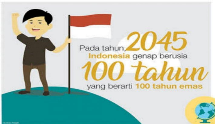
Gambar 6.4: Bonus Demografi 2045