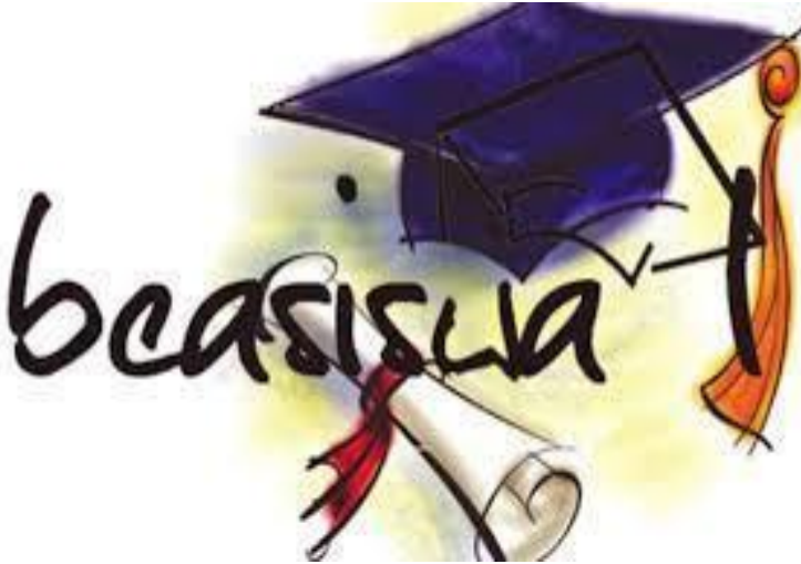
Gambar 14.1: Ilustrasi Beasiswa

Program beasiswa dapat saja memberikan kesempatan yang luas bagi penerimanya, seperti kesempatan magang, mentoring atau akses ke jaringan profesional yang memungkinkan peningkatan peluang karir di masa yang akan datang.