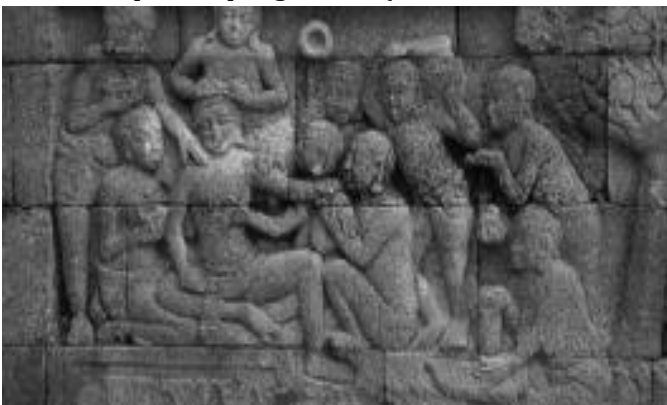
Gambar 4.1: Relief Candi Borobudur

Sejak lama, pijat telah dikenal di banyak negara di dunia, termasuk Indonesia. Di Indonesia, bukti tertua tentang keberadaan pijat adalah relief Candi Borobudur dari abad ke-8 dan 9 M. Ini menunjukkan bahwa Indonesia telah mengenal tradisi pijat dari abad ke-8 dan 13 abad yang lalu. Sebagai tradisi, orang-orang di masa itu melakukan pijat untuk mendapatkan pengobatan (Yudiatma and dkk, 2021).