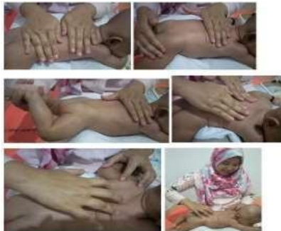
Gambar 6.6 Gerakan pada Punggung