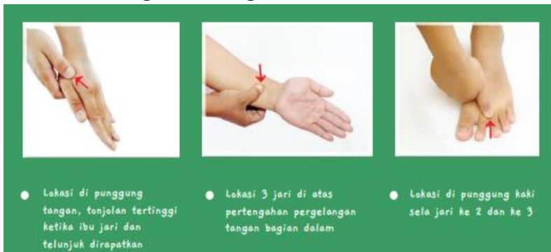
Gambar 4.13: Acupoint Cacingan