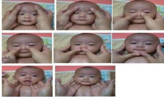
Gambar 6.5 Gerakan pada Wajah