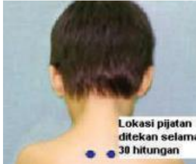
Gambar 4.12 Acupoint Batuk Pilek 4

4) Lokasi yang terdapat pada dua jari ke arah lateral dari ruas tulang punggung ketiga.